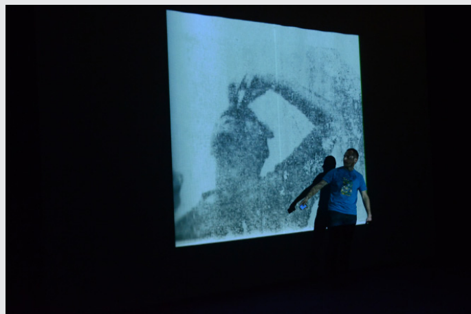
Atelier Flipbook numérique - Le Lieu Multiple avril 2014