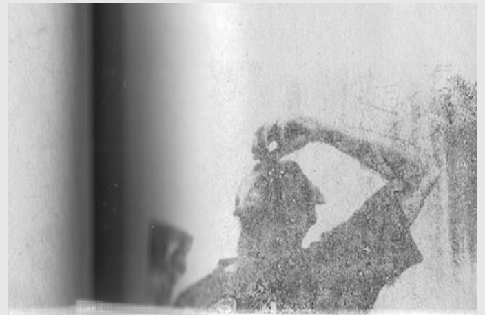
Atelier Flipbook numérique - Le Lieu Multiple avril 2014